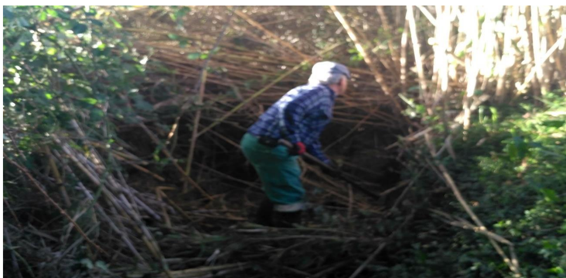
1.8 Limpeza de Valas da Freguesia